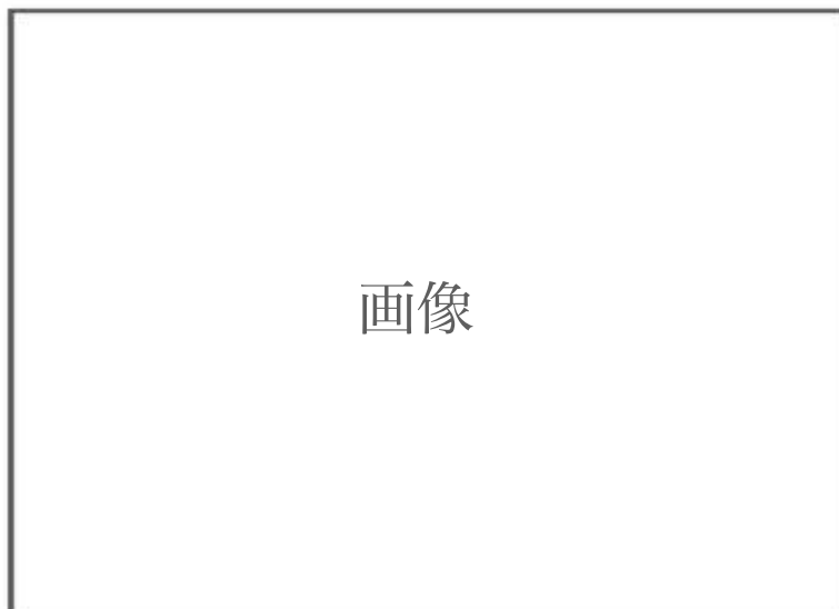
国外逃亡を図るルイ16世一家を描いた当時の風刺画

A ①1793年10月、革命裁判所において、王妃マリ＝アントワネットは、国費の浪費や、②外国との通謀などの件で、起訴された。オーストリアと交戦中のフランス革命政府にとって、敵国出身で浪費癖のあった彼女は旧体制や反革命の象徴となった。既に革命前から多くのパンフレットが彼女の素行や人格を非難しており、国王逃亡事件が彼女の主導で行われたと誇大に伝えられると(下図参照)、国民の王妃に対する信頼はさらに失われた。王妃を非難する背景には、革命期の女性の政治参加に対する、共和主義者の男性の反発もあった。彼らは、③ 公的活動を行う女性を悪い母・放蕩の妻とみなし 、その一例としてマリ＝アントワネットを提示したのだった。