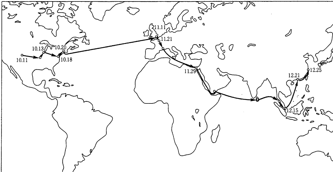
辛亥革命時の孫文の帰国ルート(数字は到着の日付を示す)

B 革命家孫文は、国際的な視野を持つ人物だった。1911年10月に ア において、辛亥革命の口火となる軍隊の蜂起が起こったとき、彼は革命宣伝と資金調達のためにアメリカ合衆国に滞在していた。このことは、④ 革命運動が留学生や華僑の支持を受け、国際的な広がりを持っていたことを、背景としていた。 革命勃発の報を受けた孫文は、いったんヨーロッパへ向かい、ロンドン・パリを経て帰国している(下図参照)。これは、いち早く革命への⑤ 列強の支持をとりつけるため だった。革命勢力は、孫文の帰国を待って、1912年初めに、 イ で新国家たる中華民国を成立させることになる。