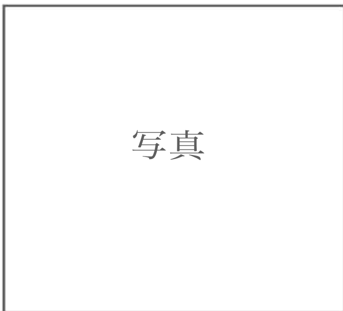
ヒエロニムス = ボスによる地獄の表現